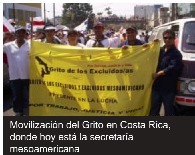
Movilización del Grito en Costa Rica, donde hoy está la secretaría mesoamericana

La exclusión social es ante todo una relación: no podemos entender al excluido sin aquél que lo