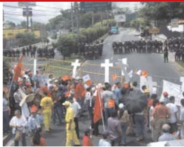
Movilización de Grito en El Salvador

Por trabajo, justicia y vida, el Grito de los Excluidos/as está presente en más de 23 países de las Américas Latina, Central e Caribe.